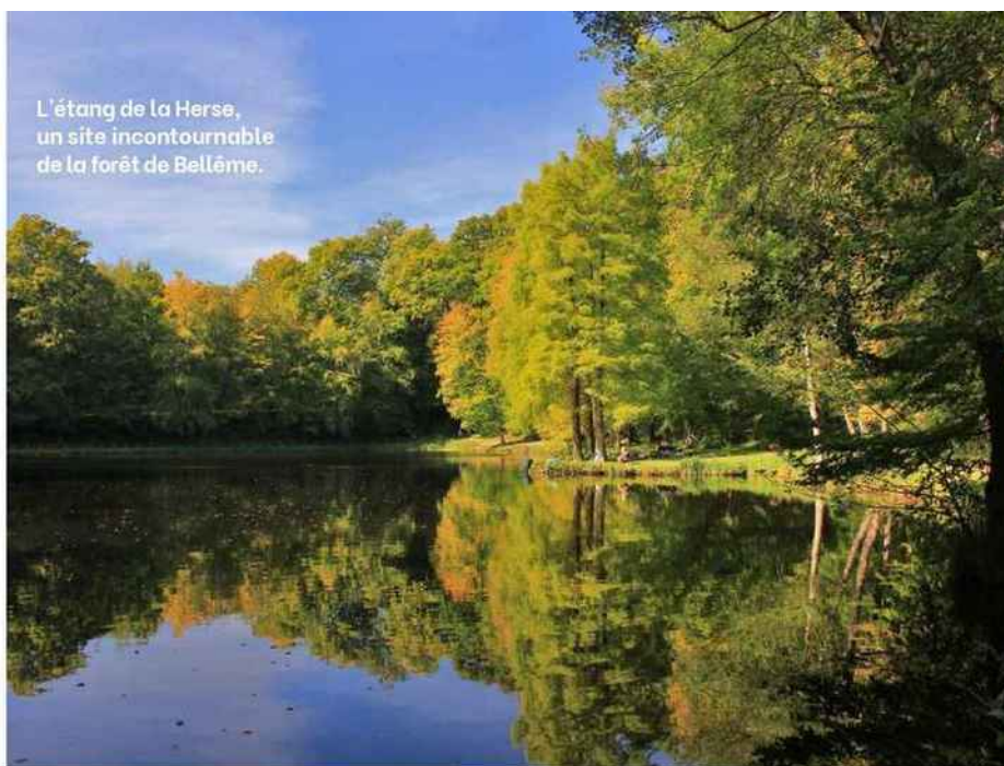
L'étang de la Herse, un site incontournable de la forêt de Bellême.

Capitale historique du Perche, Bellême a gardé des vestiges du château fort et des puissantes murailles qui défendaient la place au Moyen Age, ainsi qu'un certain nombre de maisons bourgeoises des XVII e et XVIII e siècles. Aujourd'hui, les rues et places aux façades colorées de ce bourg de 1 500 habitants accueillent ateliers et boutiques d'artisans, artistes, antiquaires et brocanteurs qui font le bonheur des chineurs, comme à Mortagne-au-Perche, l'ancienne rivale située à environ 20 kilomètres, qui distille une ambiance comparable. ●