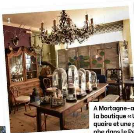
A Mortagne-au-Perche, la boutique «Un antiquaire et une photographe dans le Perche» (1), le marché (2) et le couvent St-François (3).